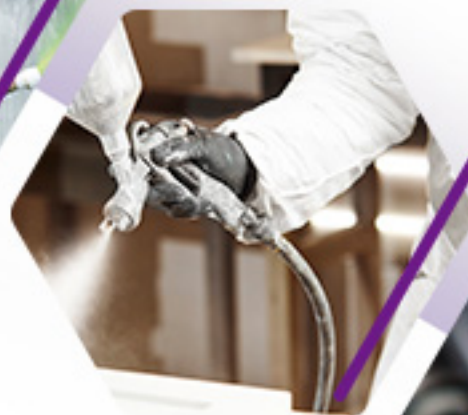
APLICACIÓN DE RECUBRIMIENTOS LÍQUIDOS