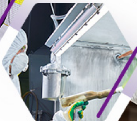
APLICACIÓN DE RECUBRIMIENTOS EN POLVO