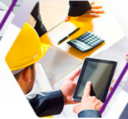
DISEÑO DE INGENIERÍA