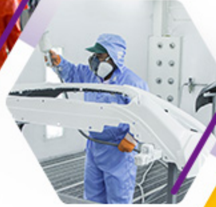
CABINAS DE APLICACIÓN