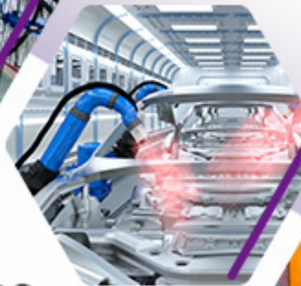
INTEGRACIÓN DE PROYECTOS