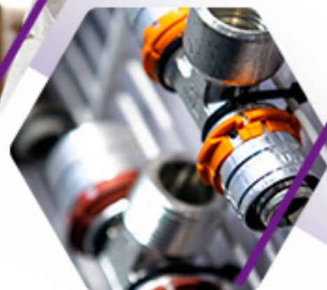
PARTES Y REFACCIONES