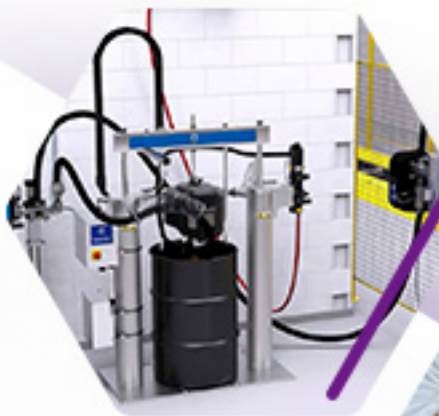
MANEJO DE FLUIDOS