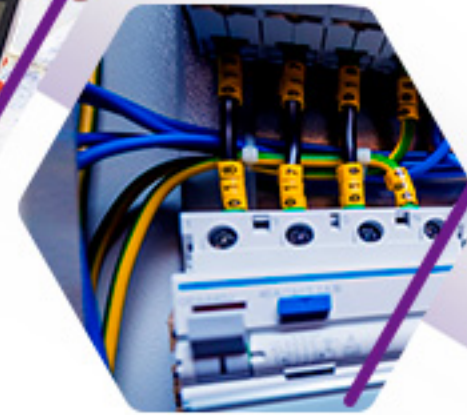
PANELES DE CONTROL