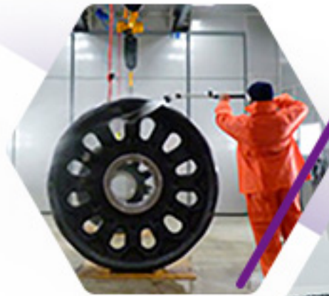
LAVADO DE PARTES