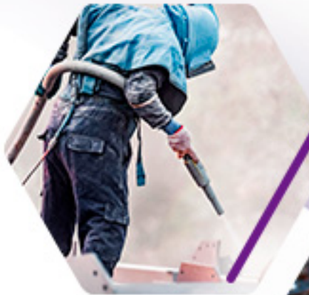
LIMPIEZA MECÁNICA (SAND BLAST)