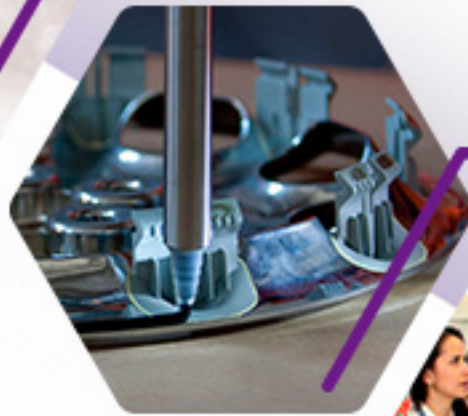
APLICACIÓN DE SELLOS Y ADHESIVOS